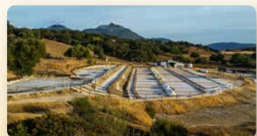
SALINAS ROMANAS (PRADO DEL REY)