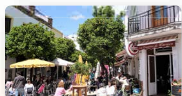
CALLE PEATONAL (PRADO DEL REY)