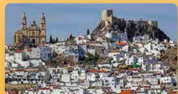
OLVERA (RUTA PUEBLOS BLANCOS)