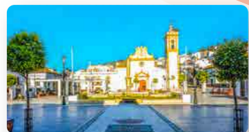
PLAZA (PRADO DEL REY)